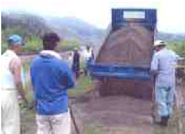
↑ 農道に砂利の補充を行いました。 補充状況を“パチッ！”

役員が、遊休農地発生状況把握のために 点検をしました。 巡回状況を“パチッ！” ↓