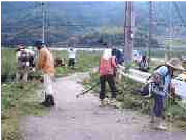
↑ 農道の草刈をしました。その状況を“パチッ！”