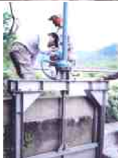
← ゲートを開閉して 通水試験をしました。